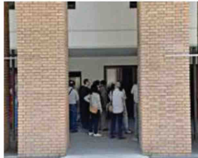
Il Piccolo Teatro

Ha da passà ‘a nuttata, dice Gennaio. Ultima battuta, si abbassa il sipario su Napoli milionaria. Che cosa succederà dopo Eduardo, da genio quale era, ce lo lascia solo immaginare. E sperare. Siamo partiti da qui, da questa frase che ne contiene tante altre, sintesi perfetta allora come oggi, nell’Italia della guerra e della ricostruzione, del coronavirus e dell’emergenza per provare a ragionare sulla funzione del teatro.