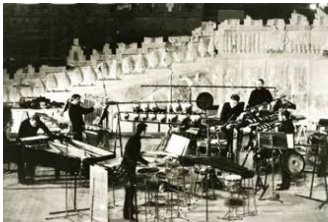
Prima assoluta di Persephassa di Xenakis, 1969, Les Percussions de Strasbourg

per sei percussionisti intorno al pubblico