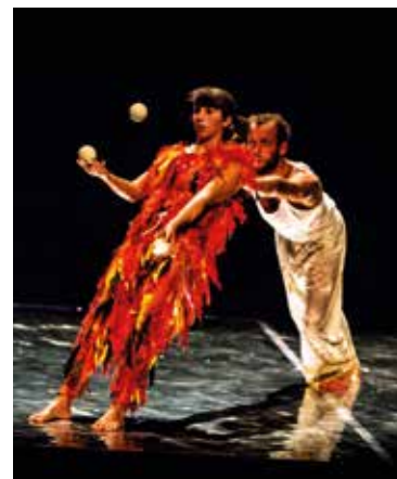
DALL'ALTO (2018)