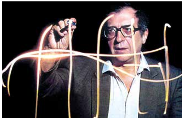
Luciano Berio, 1982.

III. Quartetto ("Grido") (2000-01) – 28'